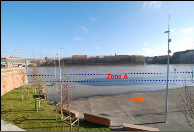
2,97 m au Pont-Neuf 21 février 2018 – 10h30