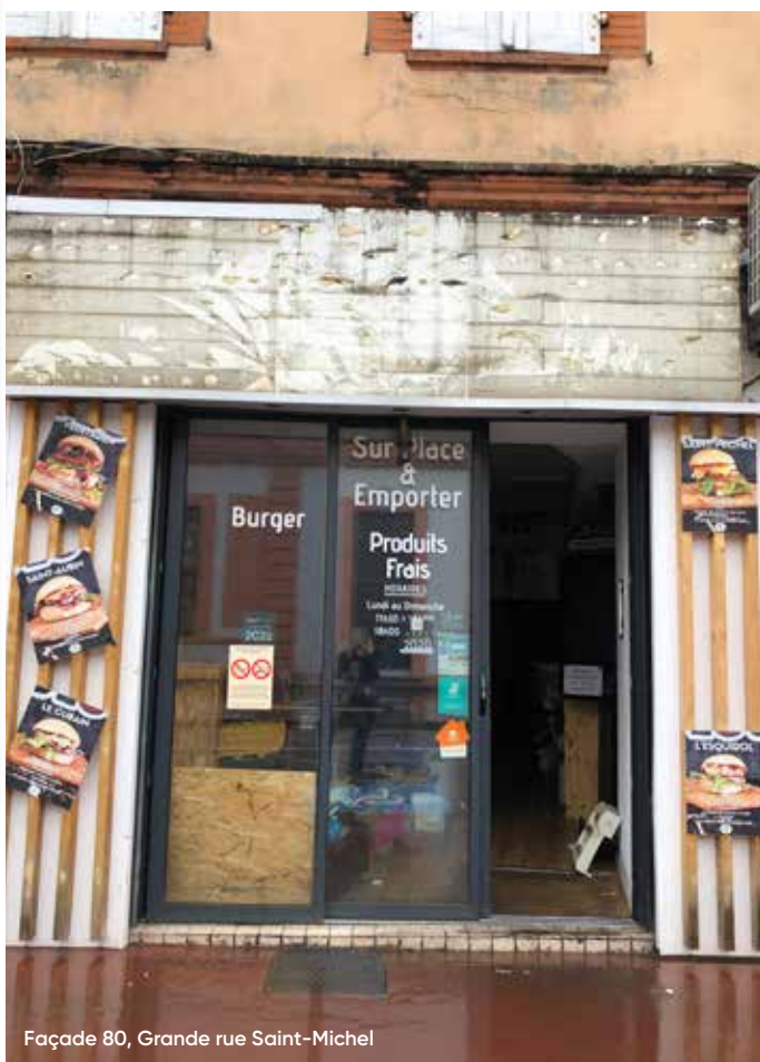
Façade 80, Grande rue Saint-Michel