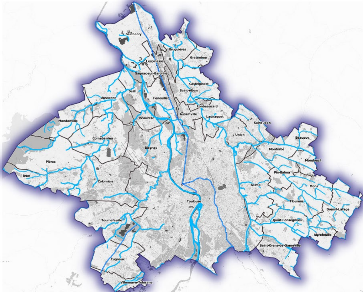
Figure 1 : Territoire de Toulouse Métropole

Cette notice présente les règles de gestion des eaux pluviales s’appliquant sur le territoire de Toulouse Métropole ainsi que leurs objectifs et le contexte de leur élaboration.