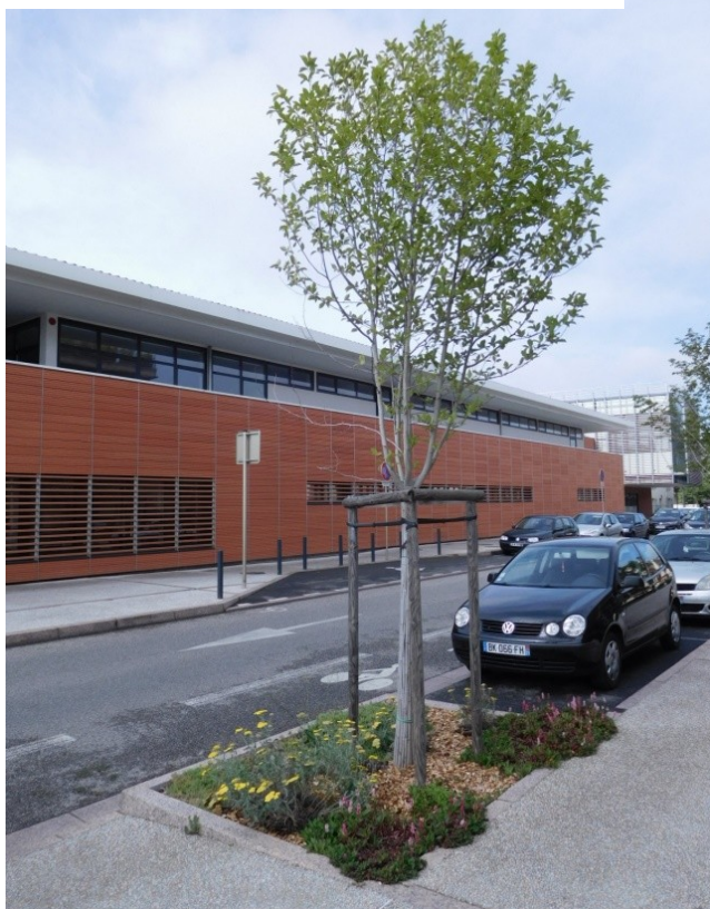
Magnolia, rue Felix Debax, Blagnac