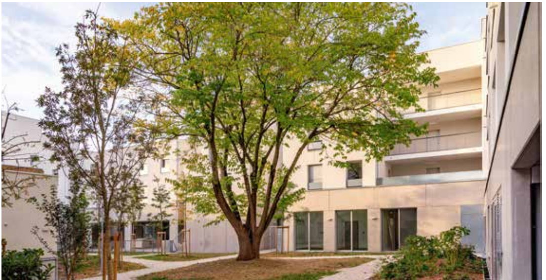
↑ Le nouvel écrin de la Cité Blanche