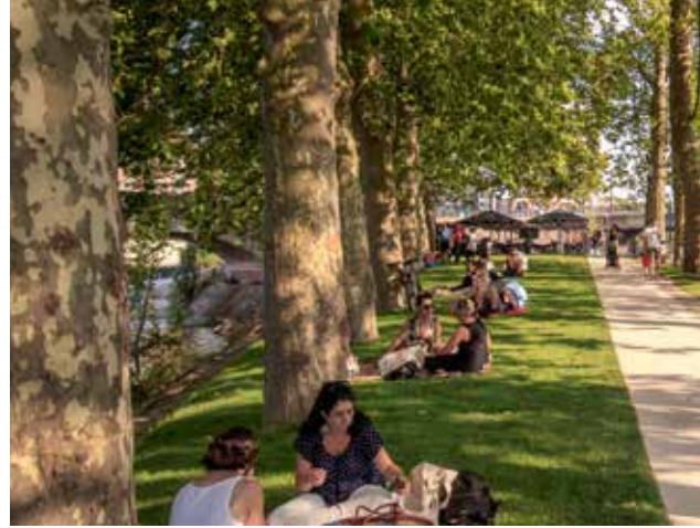
↑ La pointe de l'île du Ramier