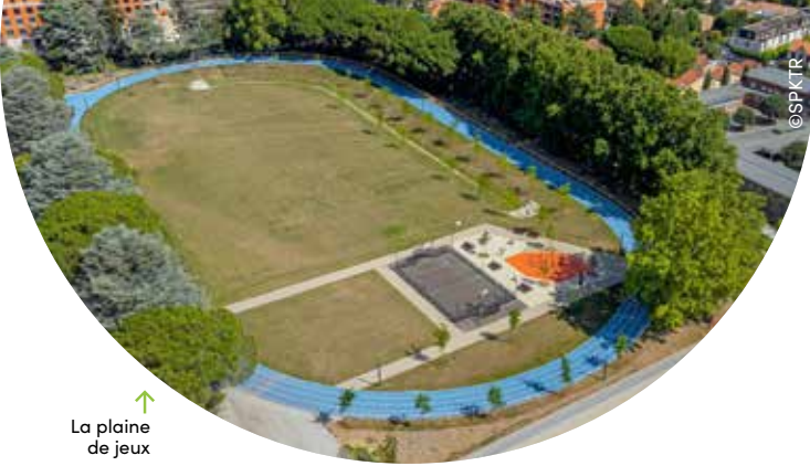
↑ La plaine de jeux