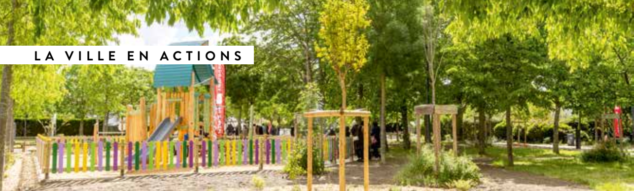
Square Vendôme, le Milan.