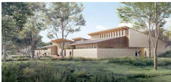
Vue du stade Rigal.

Après l'amélioration de l'offre commerciale et de services sur les places Micoulaud et Ahmed-Chenane, le quartier des Trois-Cocus poursuit sa transformation avec de nombreuses actions en faveur de sa végétalisation. Le parc des Faons, à proximité de la place éponyme, s'étoffera avec 400 arbres supplémentaires d'ici 2027. À quelques encablures, le parc Rigal (3 ha) accueillera de nouveaux arbres, des agrès sportifs dédiés à tous les âges, des fontaines à eau ainsi qu'un théâtre de verdure et des terrains de pétanque ombragés. L'ensemble sera maillé par