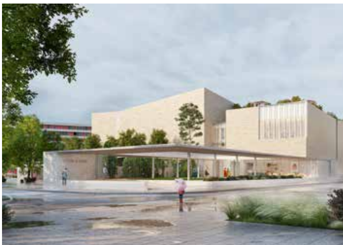
La future Cité de la danse.

Dans ce quartier, la transformation urbaine, dont le programme court jusqu'en 2030, avance sur plusieurs fronts, avec une priorité au logement. En plus des rénovations qui concernent deux tiers des opérations, 862 logements sociaux sont en passe d'être démolis et 1 206 seront construits sur place, dont 50 % de logements privés afin d'amener de la mixité dans le quartier, qui compte aujourd'hui 85 % de logements sociaux. Place Abbal, la dalle sera bientôt détruite pour embellir l'espace, le verdier, l'ouvrir sur le lac et accueillir la future Cité de la danse. Un nouveau pôle commercial sortira de terre à partir de cet été. L'ouverture d'une Maison de santé, à l'automne prochain, facilitera l'accès