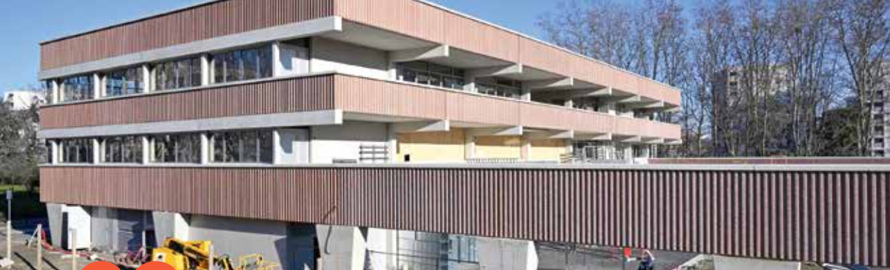
Groupe scolaire Marie Marvingt.