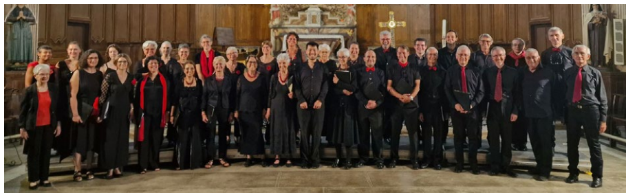
Concert à St-Felix de Lauragais à l'invitation de l'association culturelle du village, 2023