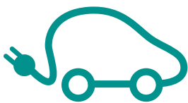
LES VÉHICULES ÉLECTRIQUES