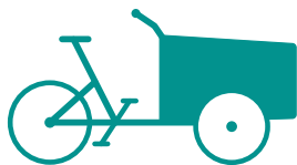
LES VÉHICULES NON-MOTORISÉS