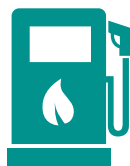
LES VÉHICULES BIO GNV