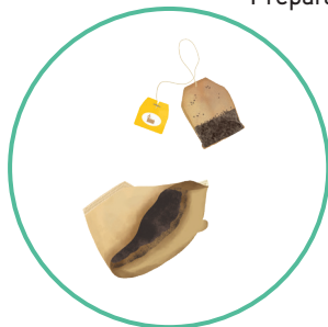
Thé et café (vrac, sachet, filtre)