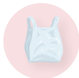
Sacs plastiques (même compostables!)