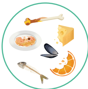
Restes de repas