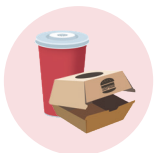
Emballages et aliments emballés