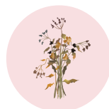
Déchets végétaux (issus du jardin)