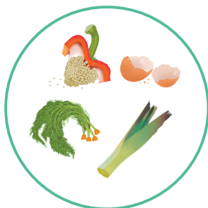
Préparation de repas