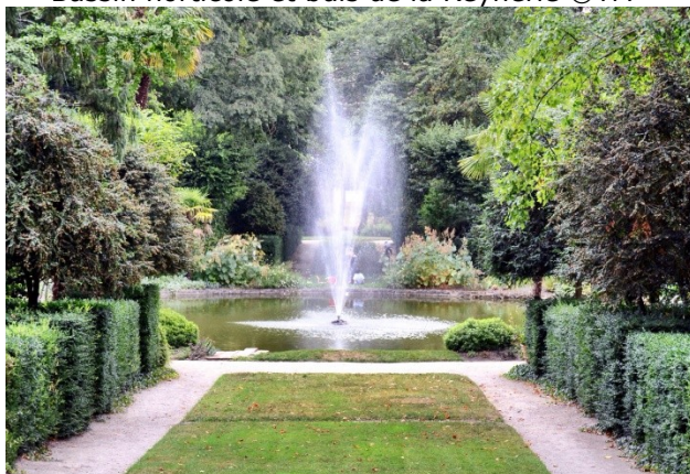
Bassin horticole et buis de la Reynerie