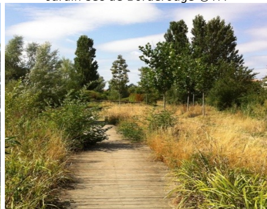
Jardin sec de Borderouge