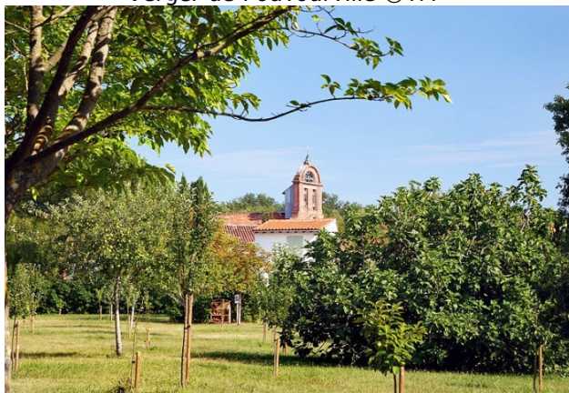
Verger de Pouvoirville