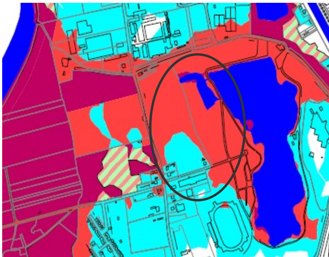
Extrait cartographique du zonage du PPRI de la Ville de Toulouse / 20 décembre 2011