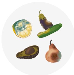
Produits alimentaires périmés sans emballage