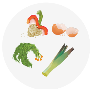
Préparation de repas