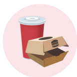
Emballages et aliments emballés