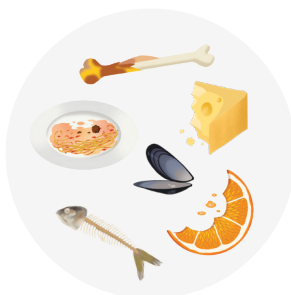
Restes de repas