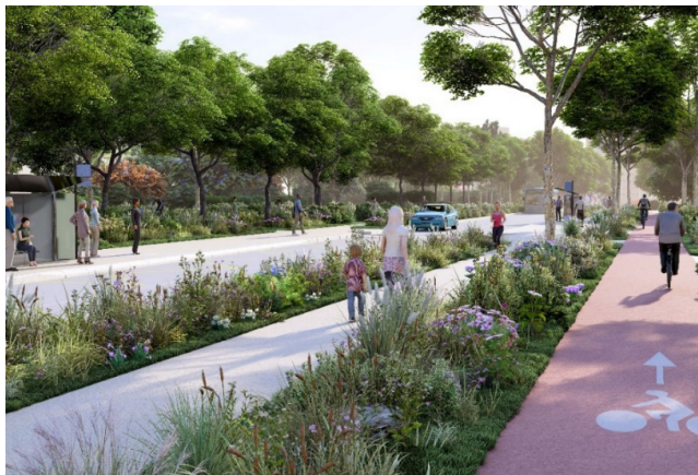
Vue sur les Allées Bellefontaine ouest après travaux

L'aménagement des espaces publics peut maintenant débuter !