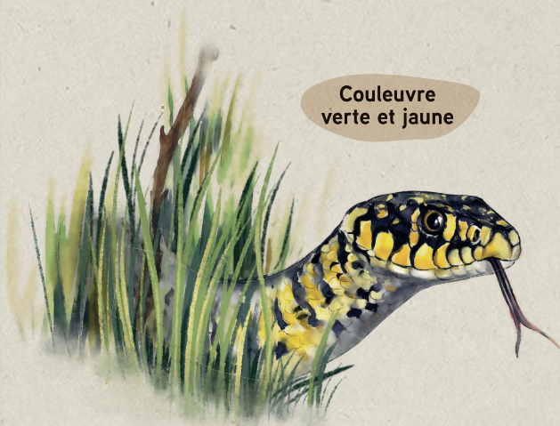
Couleuvre verte et jaune

Très craintive, cette couleuvre prendra la fuite au moindre mouvement. Elle se cache dans les haies et les broussailles, en quête de quelques rongeurs ou d'amphibiens à se mettre dans la panse. Elle ne possède pas de venin.