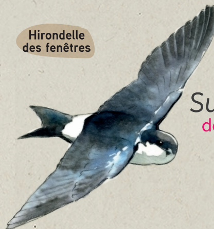
Hirondelle des fenêtres