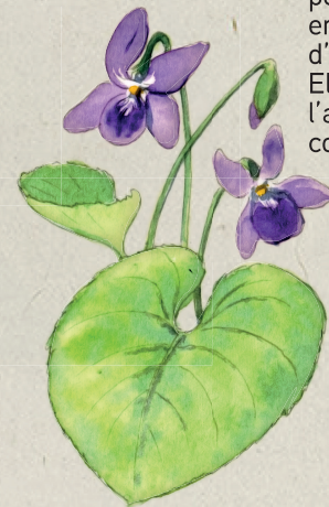
Violette des bois

Annonciatrice du printemps, vous pourrez observer cette emblématique fleur d'avril à mai. Elle s'épanouit à l'abri du soleil, sous le couvert des arbres.