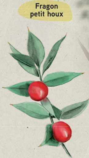
Fragon petit houx