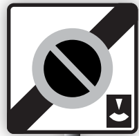
Panneau de sortie