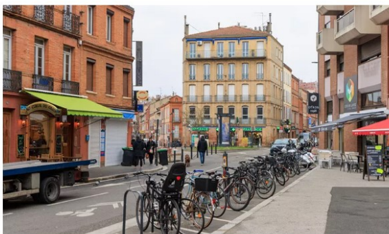
Les travaux d'aménagement de la rue Pierre-Paul Riquet démarrent le 20 février. Cette première phase durera environ 3 mois.

Piétons, cyclistes, automobilistes et riverains ... tous profiteront du réaménagement de la rue Pierre-Paul Riquet. Voici les détails.