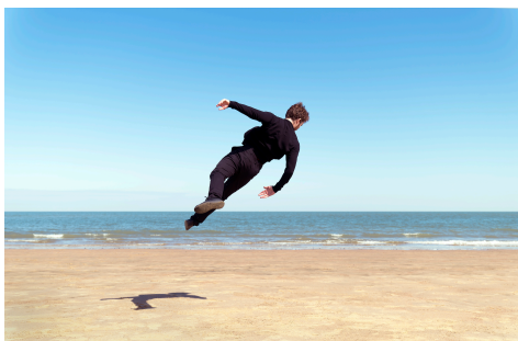
spectacle Moon