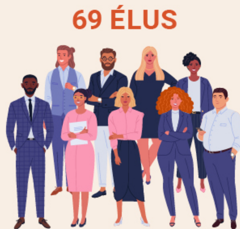
les conseillers municipaux (délégués + municipaux)

↓ Tous sont élus au suffrage universel direct pour six ans.