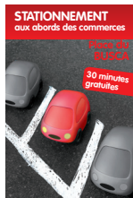
Stationnement aux abords des commerces