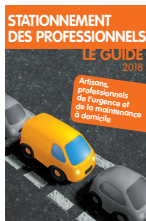
Stationnement des professionnels