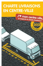
Charte livraisons en centre-ville