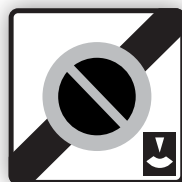
Panneau de sortie