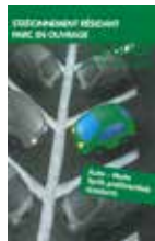
Stationnement résident parc en ouvrage