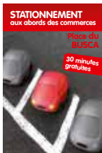
Stationnement aux abords des commerces