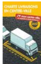
Charte livraisons en centre-ville