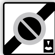
Panneau de sortie