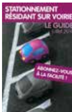
Stationnement résident sur voirie