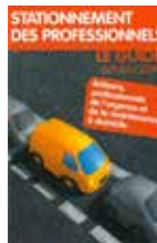
Stationnement des professionnels