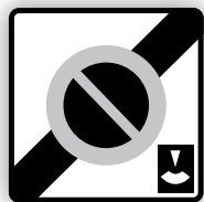
Panneau de sortie