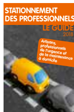
Stationnement des professionnels