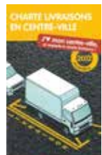
Charte livraisons en centre-ville