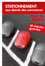
Stationnement aux abords des commerces