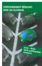
Stationnement résident parc en ouvrage