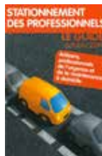
Stationnement des professionnels