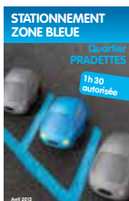
Stationnement zone bleue