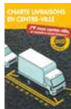
Charte livraisons en centre-ville