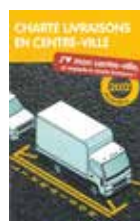
Charte livraisons en centre-ville