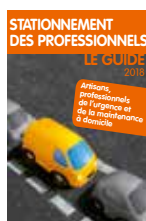
Stationnement des professionnels