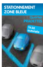
Stationnement zone bleue