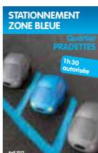
Stationnement zone bleue