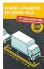
Charte livraisons en centre-ville