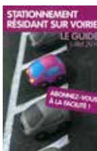
Stationnement résident sur voirie