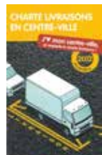
Charte livraisons en centre-ville