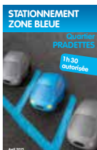
Stationnement zone bleue