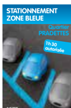
Stationnement zone bleue