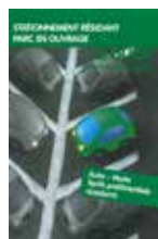
Stationnement résident parc en ouvrage