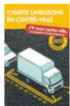
Charte livraisons en centre-ville