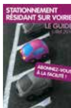
Stationnement résident sur voirie