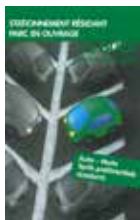
Stationnement résidant parc en ouvrage