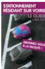
Stationnement résidant sur voirie