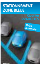
Stationnement zone bleue