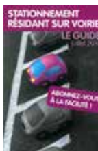
Stationnement résident sur voirie