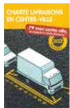
Charte livraisons en centre-ville