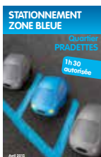
Stationnement zone bleue