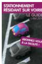
Stationnement résident sur voirie