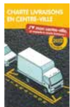
Charte livraisons en centre-ville