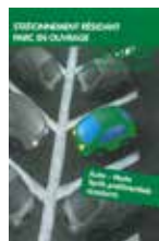
Stationnement résident parc en ouvrage