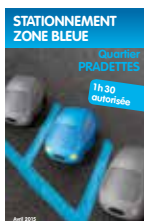
Stationnement zone bleue