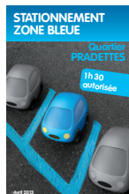
Stationnement zone bleue