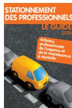
Stationnement des professionnels