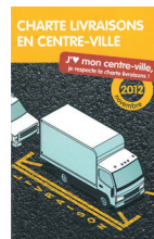
Charte livraisons en centre-ville