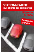
Stationnement aux abords des commerces