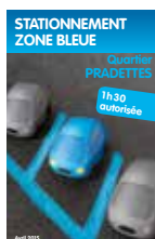
Stationnement zone bleue