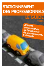
Stationnement des professionnels