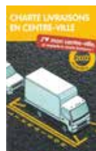
Charte livraisons en centre-ville