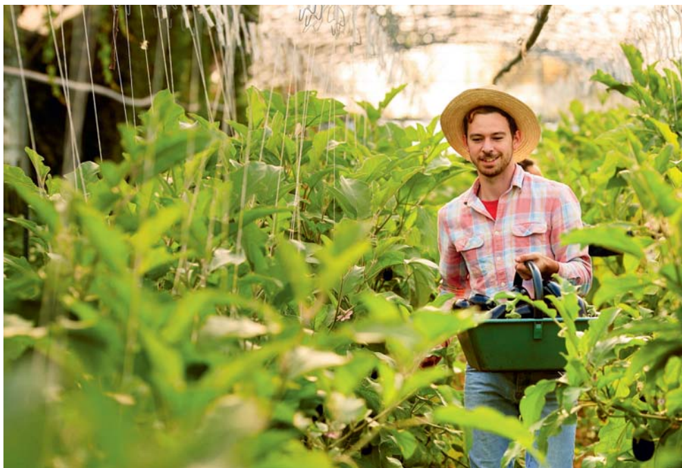
Quartier Trois-Cocus, la ferme de Borde Bio cultive des légumes bio en plein Toulouse.

Producteurs actifs, acquisitions de terres agricoles, partenariats et chartes signés avec différentes communes, aides à l'installation des jeunes agriculteurs, études sur les bassins de consommation, réflexion autour de la restauration collective ou avec le Grand Marché (ex Marché-gare)... La reconquête des terres agricoles et des circuits de distribution est en cours sur le territoire de Toulouse Métropole. Objectifs : produire et consommer local. Tour d'horizon des nouvelles fermes urbaines.