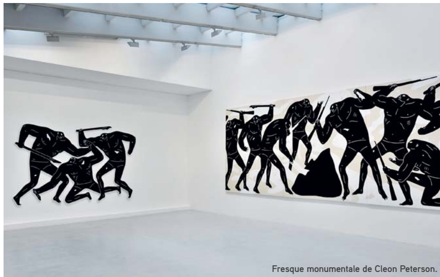
Fresque monumentale de Cleon Peterson.

D es fresques murales monumentales, une balançoire accrochée au pont Saint-Pierre... Depuis ce printemps, vous avez peut-être découvert les œuvres de Rose Béton dans Toulouse. Pour sa 3 e édition, la biennale d'art urbain et contemporain a fait la part belle au métissage des genres en invitant une dizaine d'artistes de tous horizons. D'avril à août, ils sont intervenus dans l'espace public à tour de rôle, et, cet automne, le musée des Abattoirs accueille la suite de la collection. Trois artistes de la scène interna-