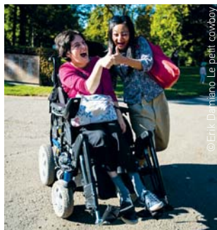
© Erik Di Miano - Le petit cowbey