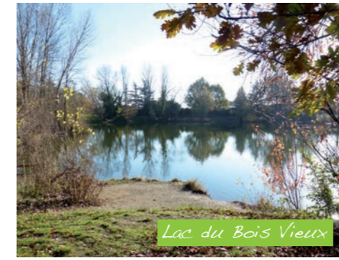
Lac du Bois Vieux

Ce lac, à proximité du collège Jacqueline-Auriol, est aménagé pour la promenade et la pêche. Il est équipé d'une aire de jeux pour enfants et d'un terrain de pétanque.