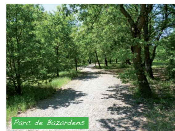
Parc de Bazardens

Cette base de loisirs permet aussi bien la détente que l'activité sportive grâce à quelques équipements sportifs.