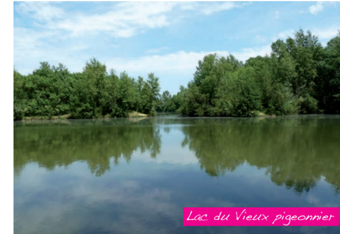
Lac du Vieux pigeonier

Le lac et ses abords sont aménagés en zone verte de loisirs le long de la promenade du Touch. Vous apercevrez un petit ouvrage hydraulique. Cet ouvrage sert à alimenter le lac en eau venant du Canal de Saint-Martory.