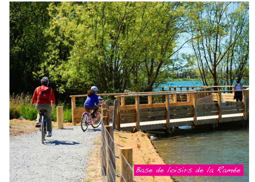
Base de loisirs de la Ramée