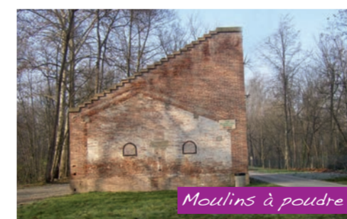
Moulins à poudre

De l'autre côté de la rue, le parc du Cabriol, traversé par le ruisseau de l'Armurier, permet de belles promenades ombragées.