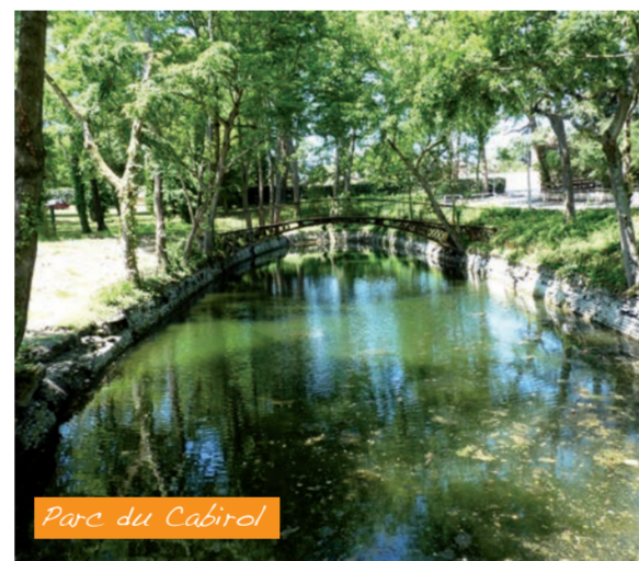
Parc du Cabriol