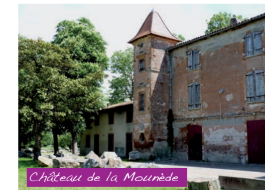
Château de la Mounède

Ce château, qui appartient à la ville de Toulouse, est entouré d'un grand parc avec des arbres centenaires et une voie verte qui rejoint la base de loisirs de la Ramée à quelques centaines de mètres. Le bâtiment accueille de nombreux concerts.