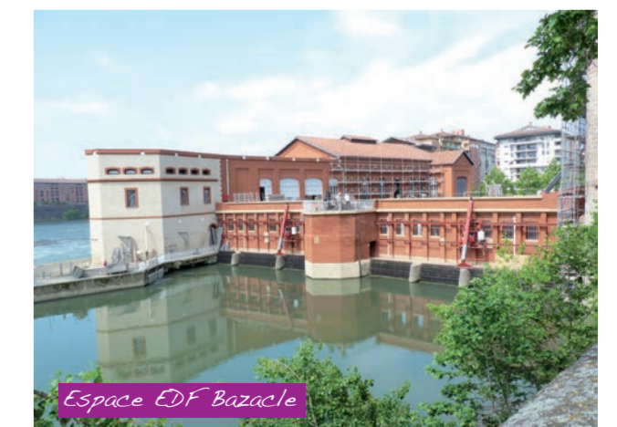
Espace EDF Bazacle

Au cœur de Toulouse près de la Garonne, l'Espace EDF-Bazacle est une usine hydroélectrique toujours en activité. Construit sur le site d'un ancien moulin dont l'origine remonte au XI e siècle, le Bazacle a ouvert en septembre 2002 une partie de ses espaces à l'accueil d'expositions. Visite gratuite du site avec guide possible.