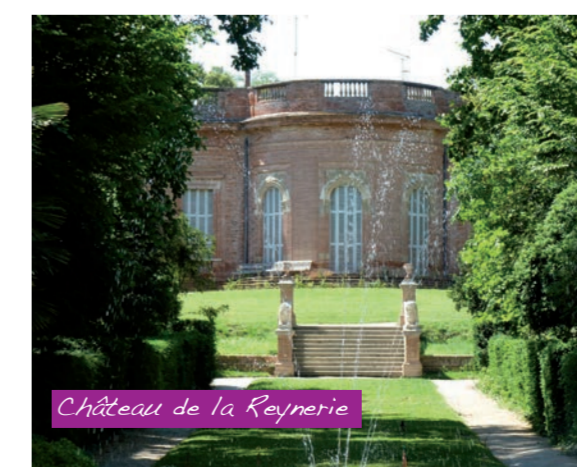
Château de la Reynerie

C'est en 1666 que furent créés les « Moulins à Poudre Royaux », ancêtres de la chimie militaro-industrielle toulousaine. Aujourd'hui, ils servent de salles d'activités culturelles ou sportives ou d'ateliers des services techniques municipaux.