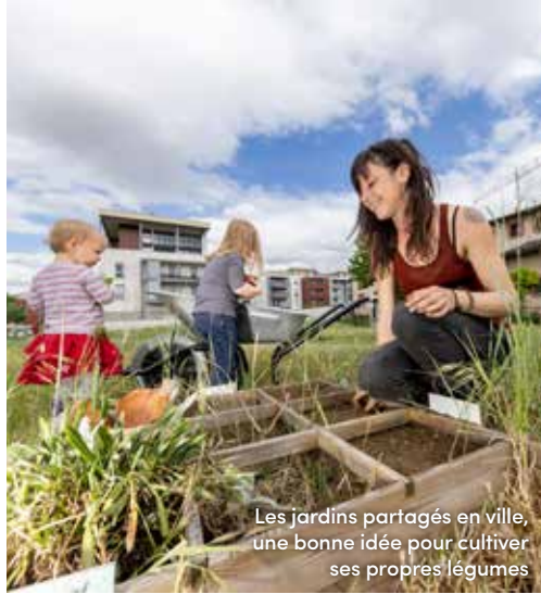
Les jardins partagés en ville, une bonne idée pour cultiver ses propres légumes

Q uelles idées avez-vous pour agir en faveur de l'écologie dans votre quartier ? C'est la question que la Mairie pose aux habitants cet été, dans le cadre d'une consultation citoyenne ( lire page ci-contre ). Composteurs collectifs, installations solaires, plantations d'arbres, d'arbustes ou de fleurs sur l'espace public ou privé (tel que le parking d'une entreprise)... : toutes les idées écologiques sont les bienvenues. « Cette démarche innovante vise à accélérer la transition écologique en mettant en place des actions à