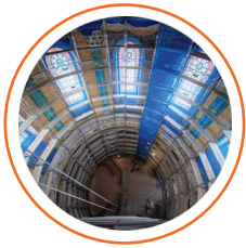
Inauguration de la chapelle St Joseph, à la Grave