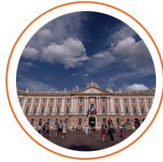
Achèvement de la rénovation du Capitole et des salles historiques

Augmentation de 50% du nombre d'heures réalisées grâce aux clauses d'insertion dans le cadre du Schéma de promotion des achats publics socialement et écologiquement responsables (passage de 300.000 heures par an à 450.000)