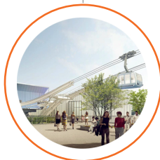
Mise en service Téléo

Sécuriser l'assainissement avec l'inauguration du centre d'hypervision à Ginestous