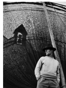
Jean Dieuzaide, Le Dimanche du pêcheur, Camara de Lobos, Madère, 1956. Mairie de Toulouse, Archives municipales