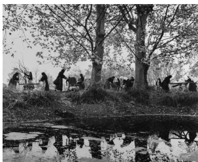
Jean Dieuzaide, Les Carmélites bûcheronnes, Carmel de Muret, 1967. Mairie de Tou- louse, Archives municipales