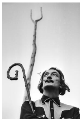
Reportage sur Salvador Dali, Port Lligat, Cada- quès, 1953