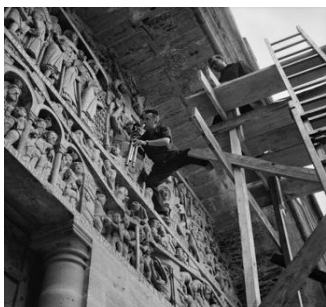
Auteur inconnu, Jean Dieuzaide sur le tympan de l'abbatiale de Conques, 1960. Mairie de Tou- louse, Archives municipales