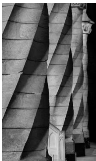
Jean Dieuzaide, Eglise Santiago, Villena, Espagne 1970 Mairie de Toulouse, Archives municipales