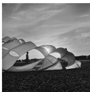
Jean Dieuzaide, Parachutisme, 1968-1970