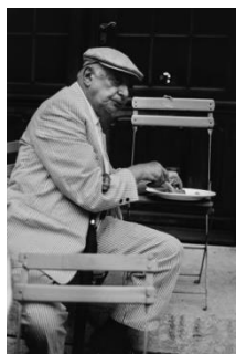
Jean Dieuzaide, Brassai dans la cour de l'hôtel L'Arlatan, Arles, 1974 - Mairie de Toulouse, Archives municipales