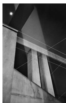
Jean Dieuzaide, Palais de Tokyo , Paris 1956. Mairie de Toulouse, Archives municipales